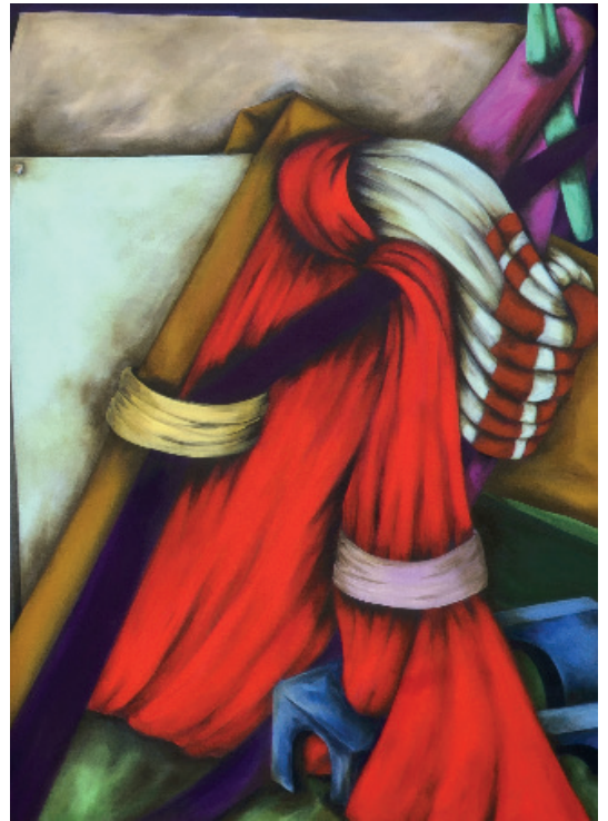
Ara Starck, L'arène , 2023 Huile et acrylique sur toile 224 x 174 cm

Ketabi Bourdet a la joie de présenter Phaos , première exposition de l'artiste française Ara Starck à la galerie.