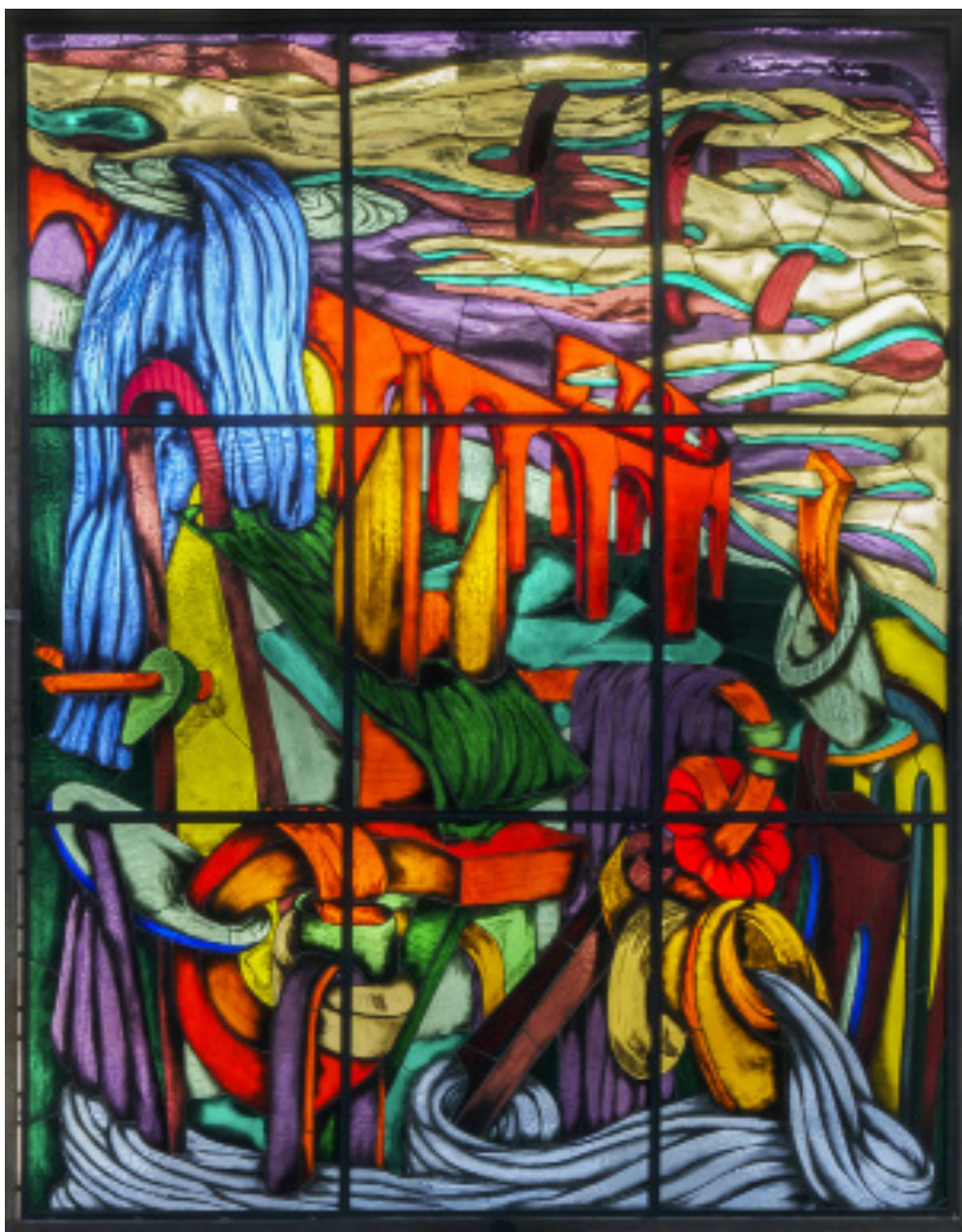
Ara Starck PHAOS (I-IX) , 2023 Glass, Lead 9 stained glass windows of 168 7/8 x 134 5/8

Through Phaos , Ara Starck invites us to reflect on light as a symbol of knowledge and truth. By transcending the limits of the visible, the artist offers us a plunge into the depths of the human soul, where light, Phaos , reveals what is often hidden.