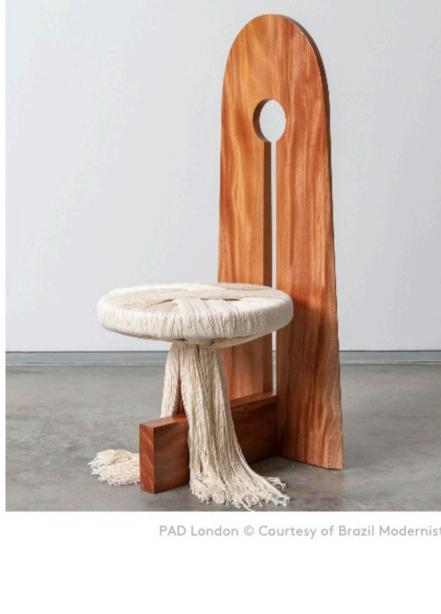
PAD London

Entre la 16 e édition de la foire de design PAD London, l'ouverture du nouveau flagship parisien de la marque de prêt-à-porter Sessùn, l'exposition retrospective de la cinéaste Chantal Akerman au Jeu de Paume, la présentation des œuvres de Guy de Rougemont à la galerie Ketabi Bourdet et lancement de la nouvelle collection d'art de la table de Buccellati, la semaine s'annonce mouvementée. De Londres à Paris, en passant par Naples, voici les rendez-vous à ne surtout pas manquer.